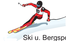
Ski u. Bergспорт