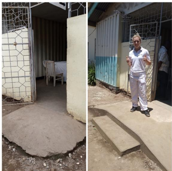
Oben: Kleine Rollstuhl-Rampe, Unten: Große Rollstuhl-Rampe

Das neue Waschbecken trifft auf große Begeisterung und wird jetzt täglich fleißig genutzt.