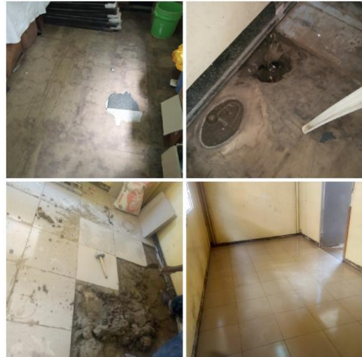
Entwicklung vom Boden

Alles ist dreckig und sehr heruntergekommen. Im Boden sind teilweise große Löcher. Ich war geschockt. Deshalb habe ich mich dazu entschieden, den kaputten, morschen Holzboden durch einen hygienischen Fliesenboden auszutauschen und den Zugang zur Physiotherapie barrierefrei zu gestalten. Jeden Tag beobachtete ich, wie sich Patienten im Rollstuhl abmühen und die Stufen nicht alleine bewältigen konnten. Außerdem war es an der Zeit die gelblich vergilbten Wände und Decke neu zu streichen, um eine Wohlfühlatmosphäre zu schaffen.